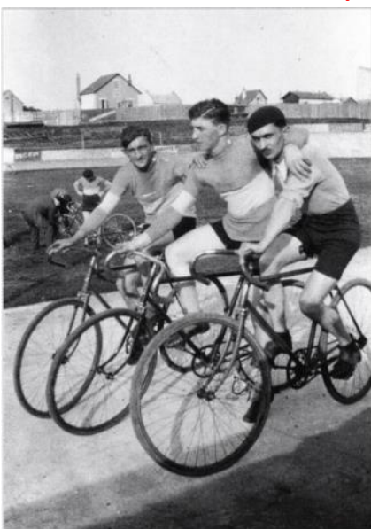
"Cyclistes sur la piste du vélodrome de Frileuse"