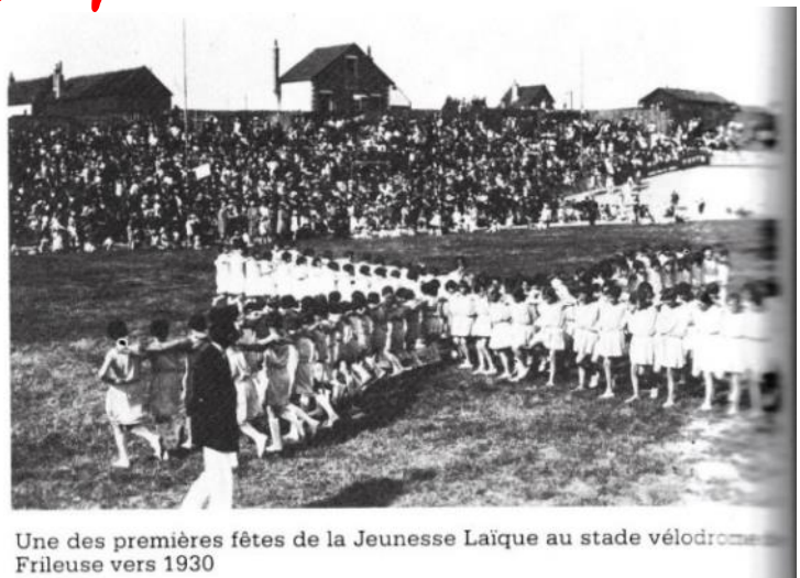
Une des premières fêtes de la Jeunesse Laïque au stade vélodrome de Frileuse vers 1930

Pour ceux qui se poseraient la question suivante : Pourquoi « Groupe Vélodrome » ? Rendez-vous sur la page de notre site : https://aucoindelavenue.wordpress.com/velodrome-de-frileuse/