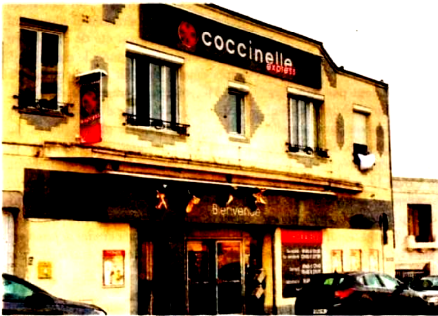
Cet immeuble du quartier Sainte-Cécile a abrité un cinéma.

Les Havrais ont volontiers fréquenté leurs cinémas de quartier des années 30 aux années 60, mais ils fermèrent, l'un après l'autre. Pour le Royal, ce fut, comme le Kursaal, cinéma de la rue de Paris, en 1977.