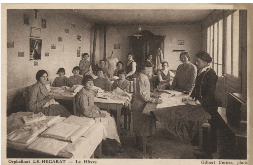
Orphelinat LE-HÉGARAT — Le Hâvre