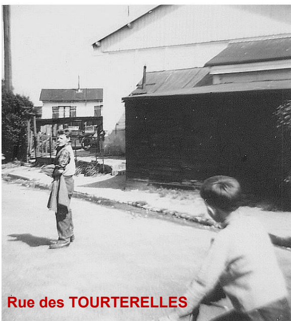
Rue des TOURTERELLES